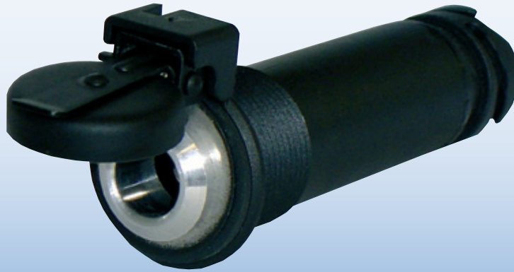
Steckdose mit Bajonettkupplung Sockets with bayonet coupling